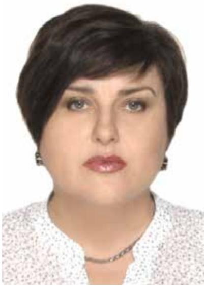
ОБ АТТЕСТАЦИИ ПЕДАГОГОВ

вательные организации Республики Калмыкия. И для того, чтобы такими льготами могли воспользоваться работники муниципальных образовательных организаций, аналогичные положения должны быть предусмотрены районным (городским) отраслевым соглашением или коллективным договором ОО.